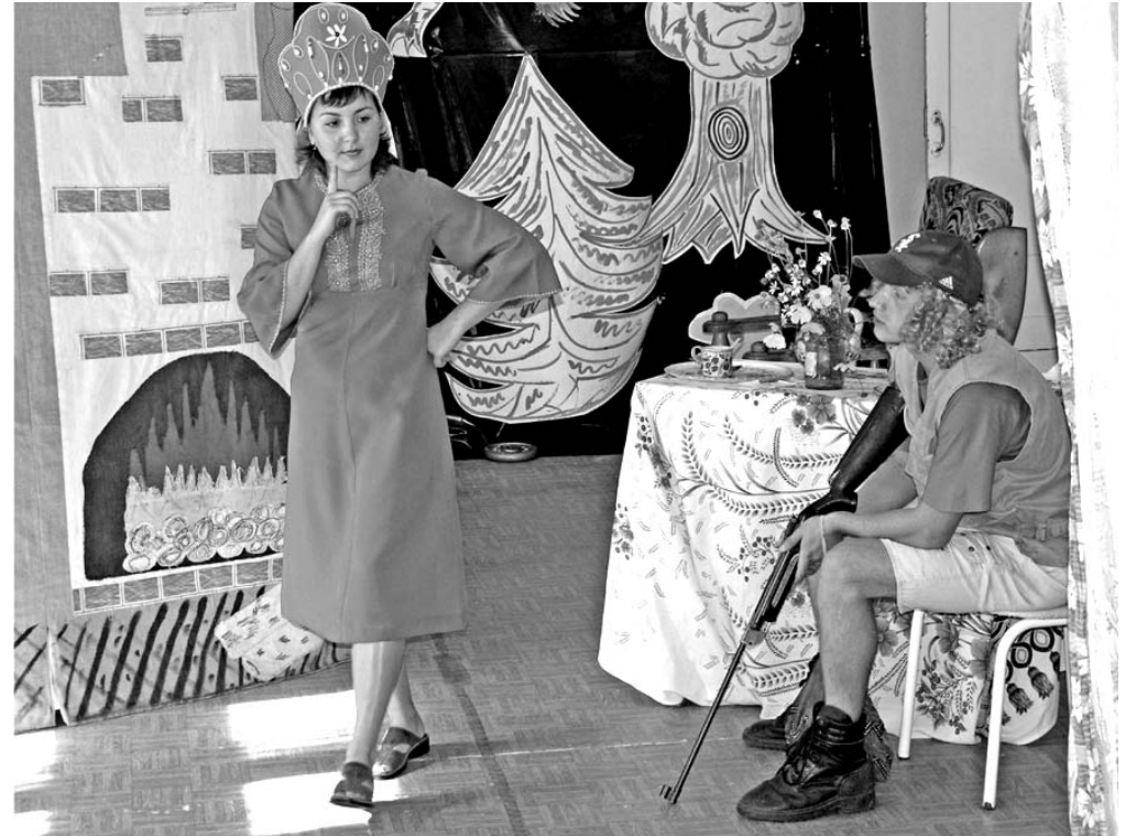
Сентябрь 2005 года. В «Перекрестке» премьера — «Сказка про Федота-стрельца». Наркоманы могут творить, думать, любить. Если научатся жить в трезвости.

Нужно, чтобы люди мобилизовались все вместе не против наркоманов, а