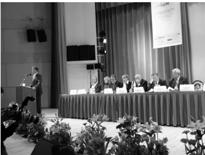
На открытии конференции выступает министр здравоохранения и социального развития Михаил Зурабов

Ларс Каллингс, специальный представитель ООН по СПИДу в странах Восточной Европы, рассказал о профилактических мероприятиях в сфере ВИЧ/СПИДа. «У СПИДа трагическая история — профилактические меры были не эффективны, потому что каждая страна делала вид, что будет отгорожена от СПИДа, поэтому никто не хотел внять слову ученых. Мы предупреждали Советский Союз об эпидемии, но там сказали, что